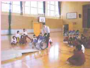
ボランティアの授業