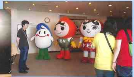
人権フェスティバル