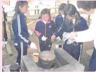
自然学校(小学校5年生)