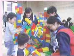
トライやる・ウィーク (中学校2年生)