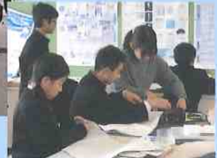
学校支援ボランティア (学校支援地域本部事業)