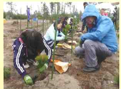
中1ギャップ解消事業