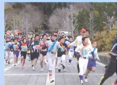
ランニングフェスティバル