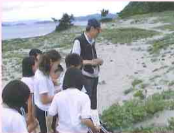
環境体験事業(小学校3年生)