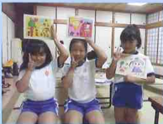
放課後子ども教室