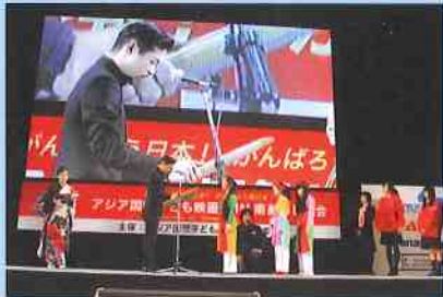
アジア国際子ども映画祭